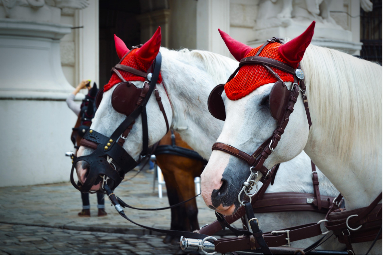
Little Red Riding Hood

Boyutları/ Dimensions: 4500x3000 Yapım Yılı/Year: 2014 Teknik Bilgiler ve Malzeme: Fotoğraf Technique and Material: Photograph